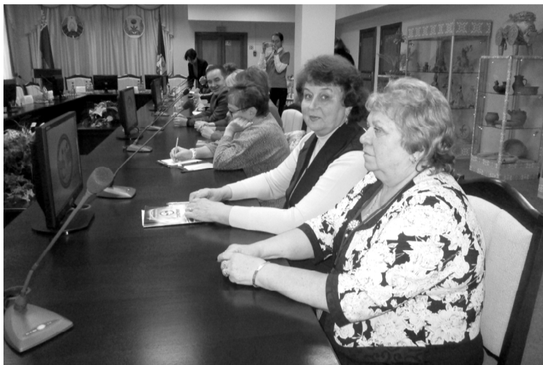
Наша делегация на пленарном заседании.

Первый день фестиваля был объявлен Днём дружбы, когда состоялась торжественная церемония открытия мероприятия и вечер дружбы «От сердца к сердцу».