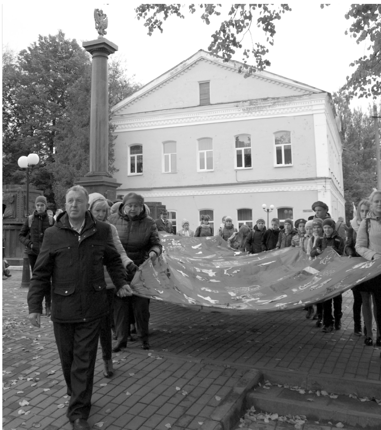
Знамя Победы, созданное юными ельнинцами.

Многих поразила глубиной переживаний маленький спектакль «Зеркало Памяти» лит. муз. композиции под названием «Не суждено нам подружками стать», поставленный командой Центра творчества. Две девушки, стоящие перед зеркалом с обеих сторон: одна в ситцевом платье, другая – в военной форме, как бы символизировали встречу двух поколений: 40-х годов и начала XXI века. Их диалог растрогал сердца всех в зале. Оказывается, вот она, машина времени – простая человеческая память.