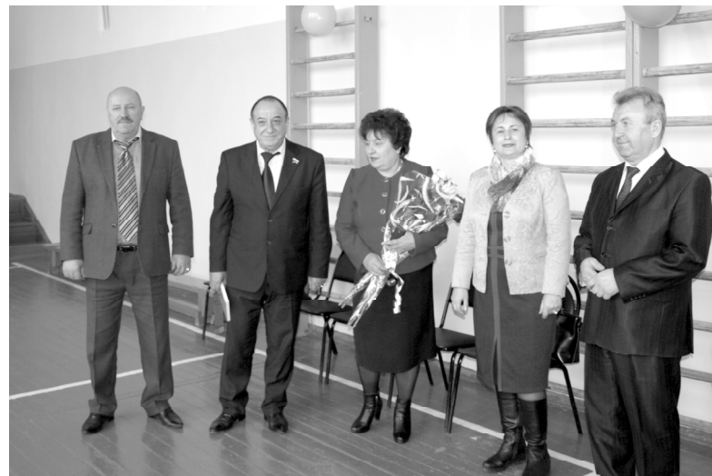
Такие добрые дела «Единой России» в районе – это всегда приятные события.

– Мы воспитываем своих учеников на славной истории наше-