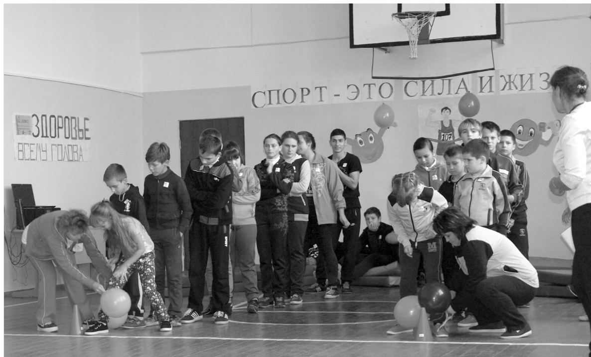
Занятия в обновлённом спортзале детям теперь приносят не только пользу, но и доставляют истинное удовольствие.

просьбу, и непосредственно специалистам Смоленской атомной станции. Но, к сожалению, основную проблему устранить не удалось.