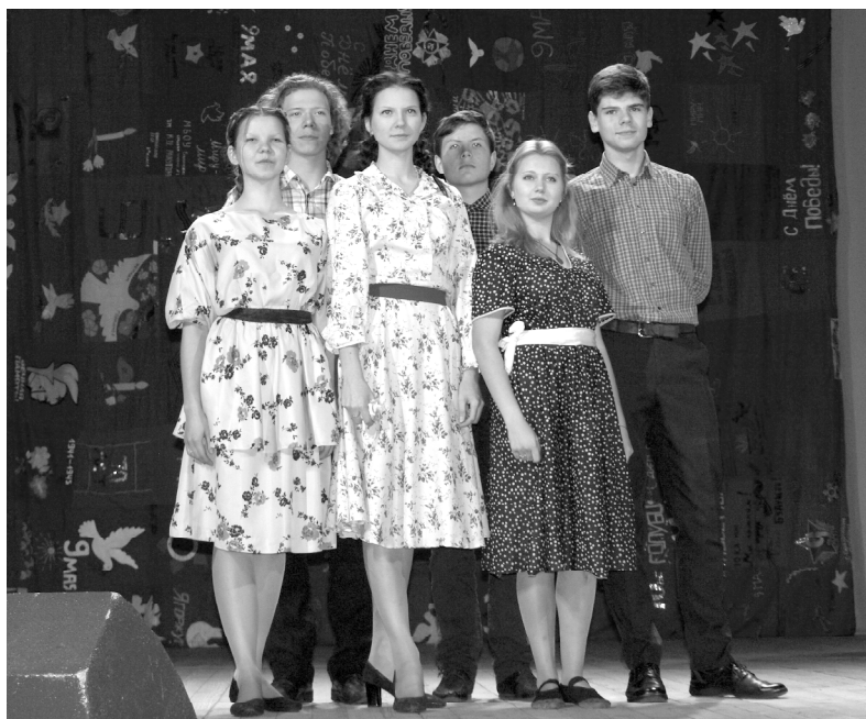
Было отраднo видеть, что нынешняя молодёжь понимает чувства своих сверстников той поры. На снимках: наши гости из Рудни; команда Десногорска.