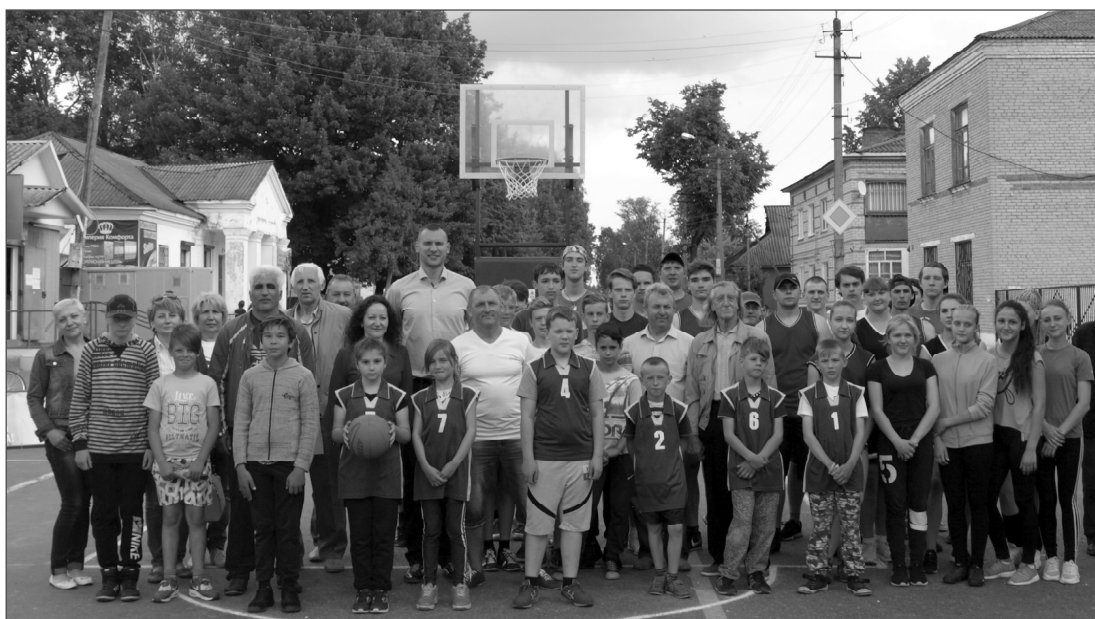
Снимок на память; и игрокам и зрителям игра приносила истинное удовольствие.