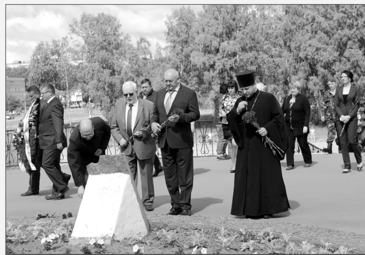
На снимке: возложение цветов.

Управление информации и общественных связей Смоленской АЭС.