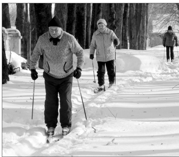
Наши ветераны и молодым не уступят.

— Мы очень любим такие совместные мероприятия на свежем воздухе. Это не только приносит пользу здоровью каждого из нас, но и даёт возможность общения друг с другом, помогает избежать одиночества, из-за которого так страдают многие пожилые люди, находящиеся на заслуженном от-