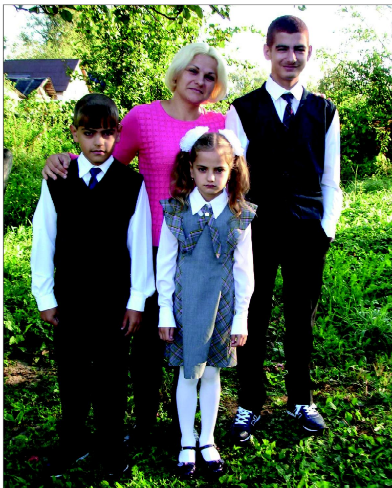
На снимках: * вот оно — мамино счастье!

* прекрасная курочка-ряба и её детки — работа Алёны Джепбаровой.