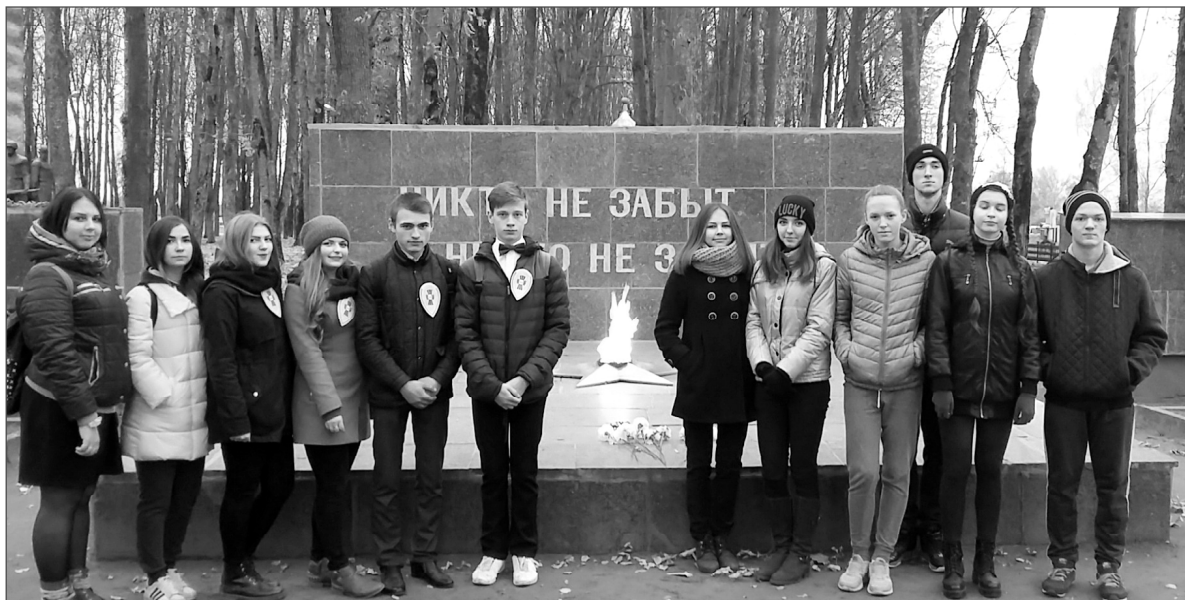
Участники квеста в сквере Боевой Славы,

21 октября 2016 года в муниципальном образовании «Ельнинский район» состоялся районный этап областного молодёжного историко-патриотического квеста «Дорогами Победы», посвящённого освобождению Смоленщины от немецко-фашистских захватчиков.