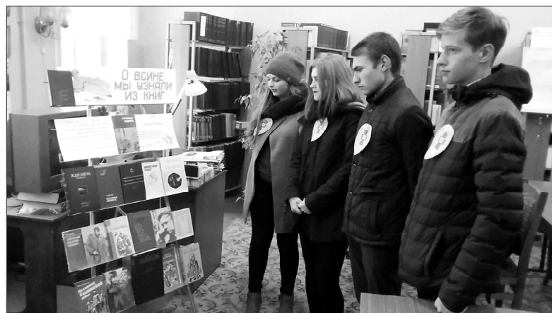
...в районной библиотеке,

Места распределились следующим образом: победила команда «Мы помним!» школы №1 им. М.И. Глинки (29 баллов), 2 место – у команды «Наследие» СШ №2 имени К.И. Ракутина (28 баллов), 3 место заняла команда «Красное знамя» СШ №3 (25 баллов). Как видите, ребята шли, как говорит-