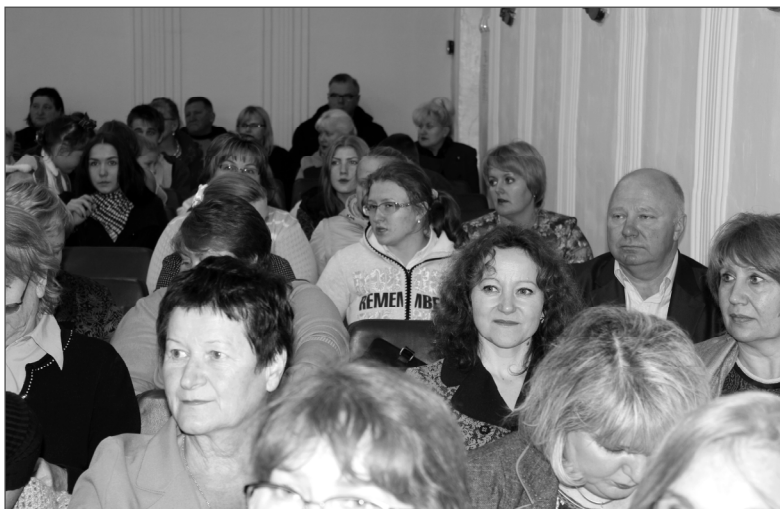
В зале собрались истинные почитатели творчества Исаковского.