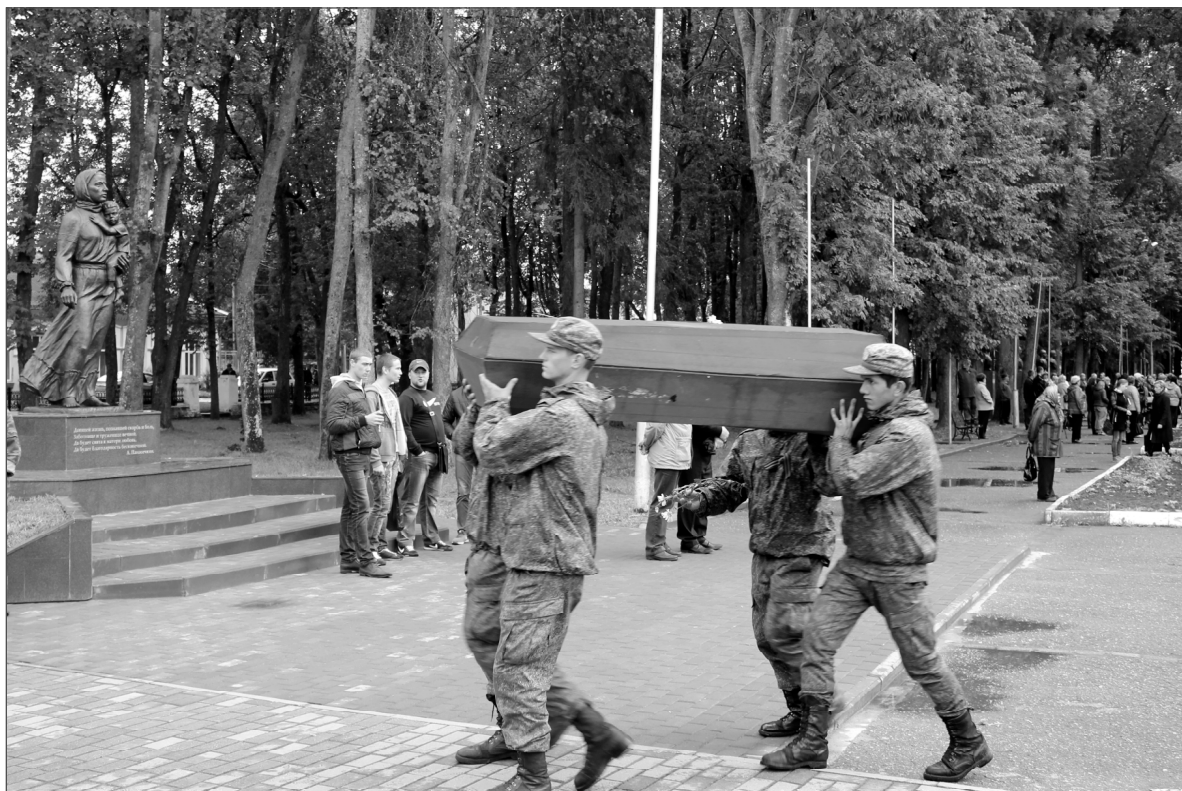
Родина-мать провожает в последний путь своих героев-защитников.