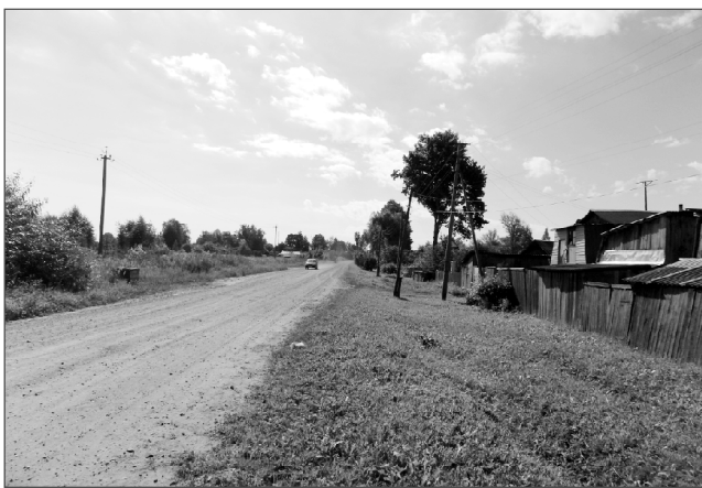
Местная власть: проблемы, решения