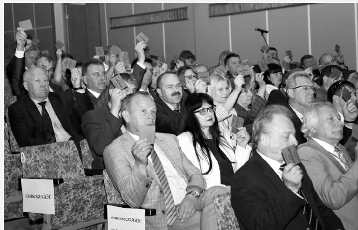
На снимке: конференция трудового коллектива Концерна Росэнергоатом.