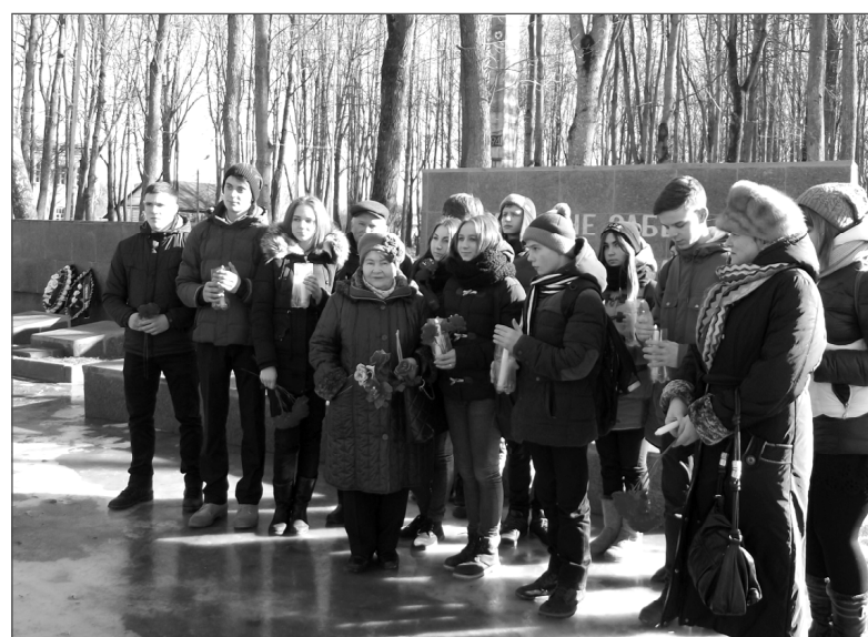
Участники операции «Свеча» в сквере Боевой Славы.

тафетах «Абордаж», «Пробоина», «Спасательные круги», «Уходим на шлюпках», «Спасатели и утопающие».