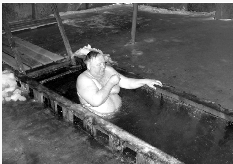
Крещенская вода и истинная вера творят настоящие чудеса.