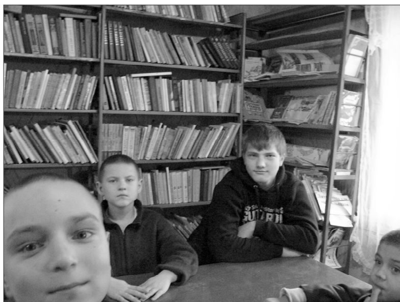
Мальчишки тоже были активными участниками интересного мероприятия.