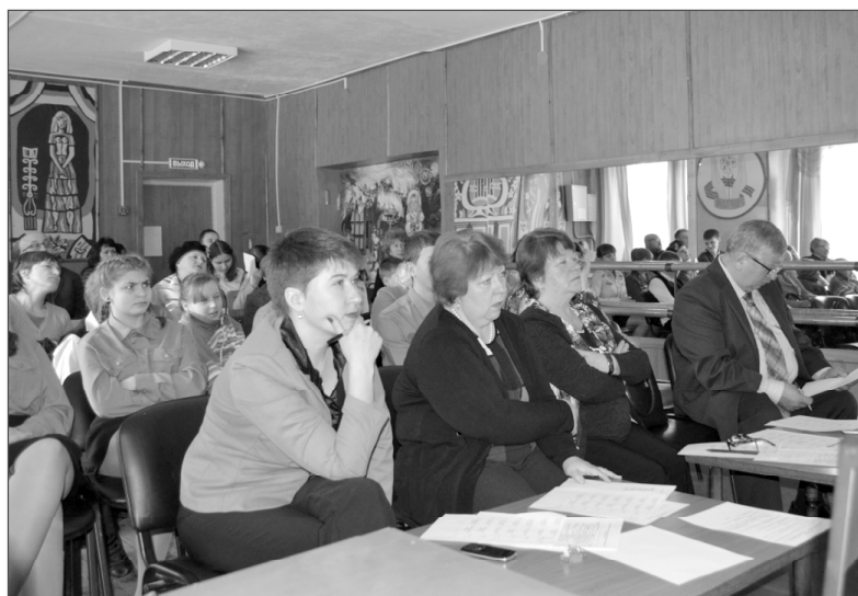
Умная и талантливая молодежь растёт на гвардейской земле.

Беспристрастному жюри предстояла нелегкая работа, так как весь представленный материал